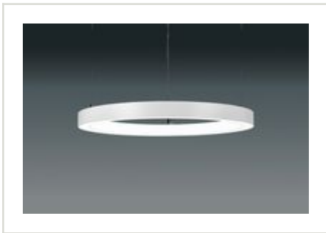
CORMA-515 Ringleuchte DALI Ø515, H53mm, 230V, 46, 1W, IP20, 3000K, CRI80-RAL9010 Artikel-Nr.: PBE021-9010

Runde Pendelleuchte mit Lichtaustritt nach innen und nach unten · für die Innenanwendung, IP20 · mit max. 3.000 mm Seilabhängung · Gehäuse: Aluminium pulverbeschichtet · Farbe Gehäuse: RAL 9010 (reinweiß) · Ausstrahlwinkel: 96° · Leistung: 46,1 W · Lichtfarbe: 3000 K · Lichtstrom: 4.608 lm · CRI: >80 · Lebensdauer L70: >= 36.000 h · Betriebsspannung: 100-240 V AC, 50/60 Hz · Schutzklasse I · Höhe: 53 mm · Außendurchmesser: 515 mm · inklusive Netzgerät, DALI dimmbar · Werkzeugloser Verschlussmechanismus für schnelle Montage